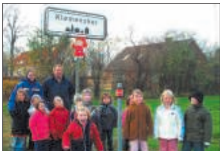
Den første nisse er hængt op og børnene er stolte.