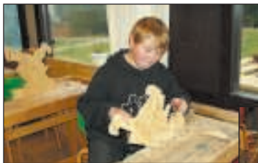
Der arbejdes på værkstedet.