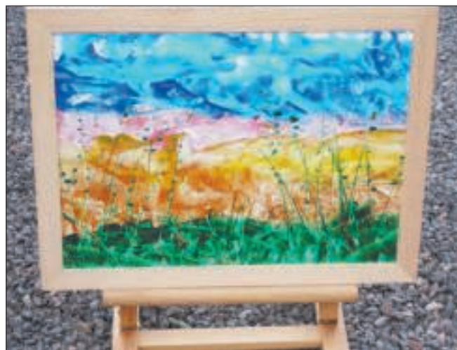
Et af Renate Kleines Eucaustik-billeder.