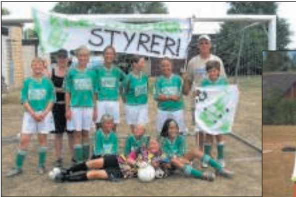
Klemensker Lilleputpiger blev vinder af rækken. Til Lykke.