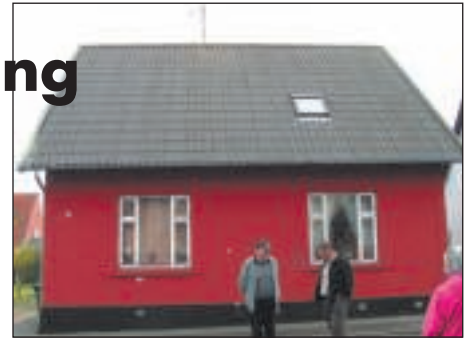
Centralen i Nygade 8.

Efteråret 1868-69 satte ind med hårde østlige og nordøstlige storme, og mangan en stolt sømand led skibsbrud og strandede på østkysten på klipperne mellem Tejn og Allinge. Her lukkede adskillige af de brave sømænd deres øjne, og skibene med deres ladning blev almindelig vrage. Skibsskrog og ladning blev solgt ved aktioner, adskillige af disse skrogladninger bestod af planker, tømmer og brædder. Her ved disse aktioner mødte fader, der godt kendte til hvad træ var, og købte træ til opførelse af et nyt stuehus. Træet kom fra tømmer og var af god kvalitet, og blev bortsolgt til en i den tid meget billig pris, således at fader ikke nøjedes med at købe til bygningen, men også til