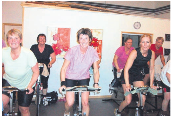
Så er der gang i cyklerne ....