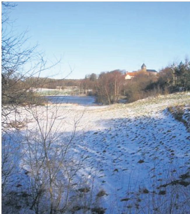
Præstemosen i vinterdragt.