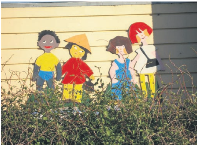
Klemensker skole.

har også givet sin mening til kende i forbindelse med Mulighedernes Land