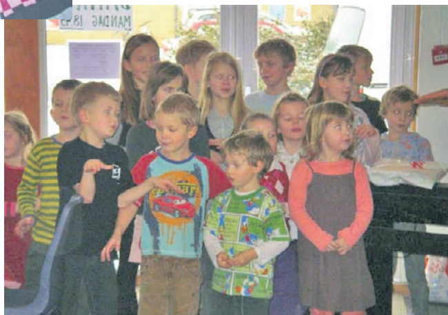
"Børnekirken" underholder.