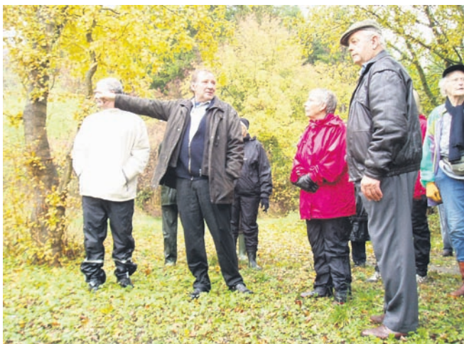
Motiv fra et offentligt arrangement den 24.10 hvor vi bl.a. så på grusgraven og Præstemosen