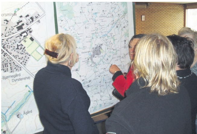
Og så skal der kigges på kort. Hvor er de gode steder?.....