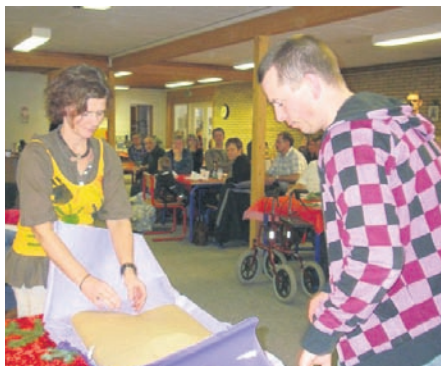
Menighedsrådets gave pakkes ud.

Begivenheden havde desværre et kedeligt efterspil, idet en stor del af deltagere blev syge dagen efter. Hvorvidt det skyldes maden eller