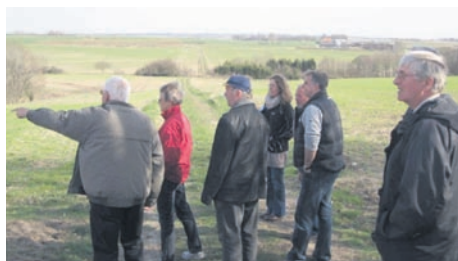
Mulighederne for dagens tur diskuteres. Skal vi gå langs skovbrynet eller ned i ådalen?

Denne dag gik turen til området sydøst for Klemensker. Vi mødtes ved stadion og gik sydpå ad en markvej der fører op mod Tornegård som ejes af mejeriet. Derfor blev markvejen hurtigt døbt "Mælkevejen". Klemensker ligger højt i landskabet, Muleby Å ligger lavt og Tornegård ligger højt. En tur denne vej evt. med en afstikker langs åen og op igennem den lille skønne skov giver derfor en meget varieret oplevelse hvor man starter med en flot udsigt væk fra byen (se foto), oplever intimiteten nede i dalen og kommer op og får en flot udsigt mod Klemenskers tage og ikke mindst kirken og BAF-tårnet. Vi gik tilbage til Klemensker langs landevejen og tog en smutvej i markkanten bag Bjørnemøllevej tilbage til stadion.