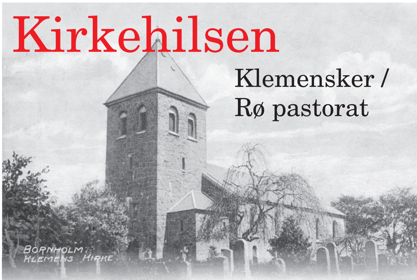
BORNHOLM KLEMENS KIRKE