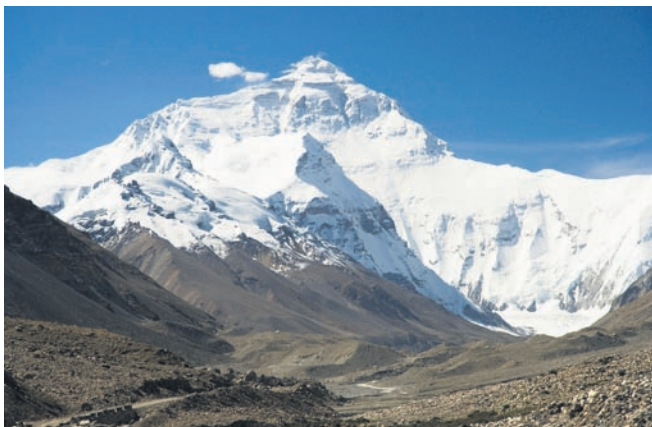
Illustration af hvilen i Gud.

Du skal bare tro på det— så skal det nok lykkes. Sådan siger mange for at opmuntre én, når man har svært ved at tro, at det vil lykkes for én, og Jesus siger det også: Alt er muligt for den, der tror (Mark. 9,23).