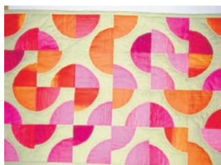
Fuld mands vej 2008