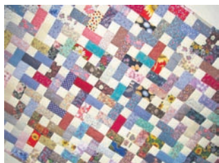
1000 stykker stof – Quilt 2010