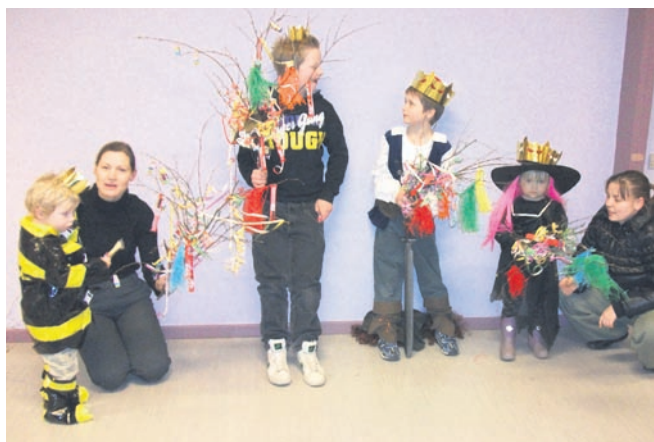
De fire vindere, kattekonge og dronning.

Traditionen tro holdt Rø Borgerforening Fastelavnsfest i Medborgerhuset Fastelavns søndag. Der var rigtig mange børn der var klædt ud og de havde taget deres forældre med.