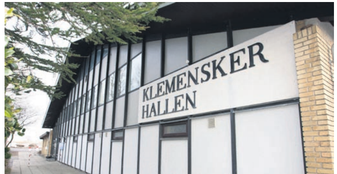
Klemensker Idrætsforening kan ikke undvære Klemensker-hallen.

Sidst, men ikke mindst må vi som Klemenskerborgere tage skarpt afstand fra den bedrøvelige og