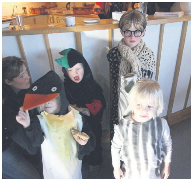
De fire der var med i konkurrencen som bedst udklædte

På vegne af Rø borgerforening Maibritt Hansen