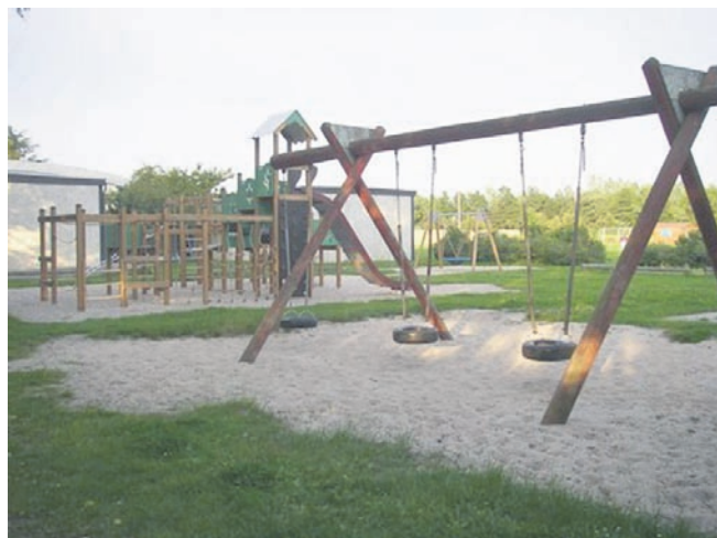
Legepladsen v. stadion i Klemensker.

Hos FRISØREN HERRE- & DAMEFRISØR Brogade 15 · Klemensker · Telefon 5696 8240