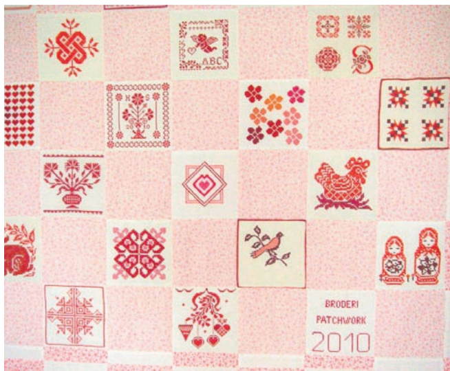
Quilten 2010 fremstillet af 40 kvinder i Europa inkl. Renate Kleine.

Du kan se denne quilt og mange patchwork-arbejder i Klemens Storegade 54, den 20.-22. september kl. 13-17.