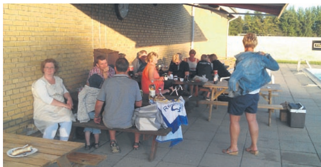
De voksne nyder aftensolen en grillaften.