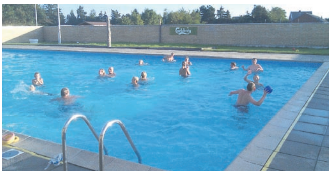
Børnene nyder vandet.