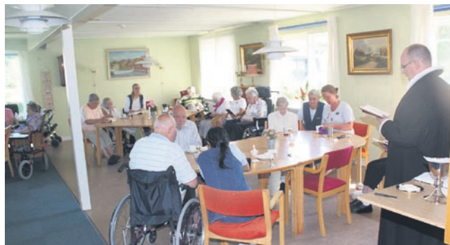
Sidste gudstjeneste på Hjemmet.

Torsdag den 26. august blev den sidste gudstjeneste afholdt for Hjemmet's beboere og fredag den 27. august blev der holdt afsked for beboere, pårørende og andre der har haft deres gang på Hjemmet.