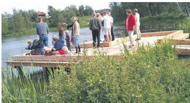
Platou og shelter indtages.

PS: - Tag en tur i Præstemosen - skulpturparken er ved at være en realitet!