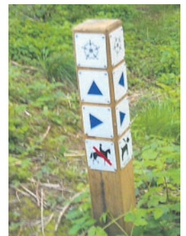
Afmærkning med logo.

Vi hører gerne fra dig, hvis du gerne vil være med til at løfte denne opgave – ikke som en ugentlig funktion, men måske en enkelt time i ny og næ.