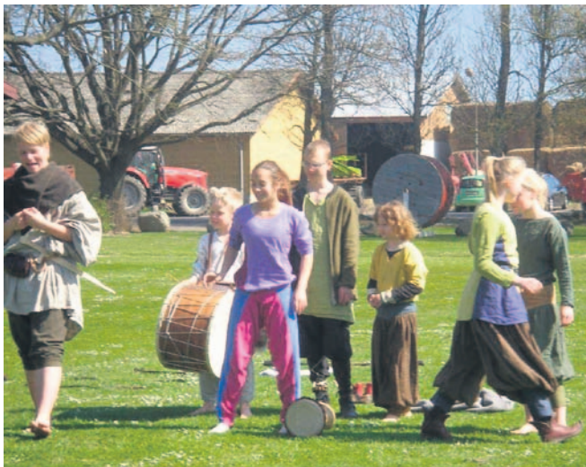
Børn / unge fra TrupTingTang fortæller gøglerhistorier med aktivitet.