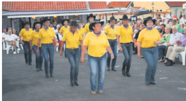
Opvisning på Sandvig Scenen 2012

Hver torsdag i tidsrummet 27. juni til 15. august kl. 20.45: Ved Sandvig Scenen.