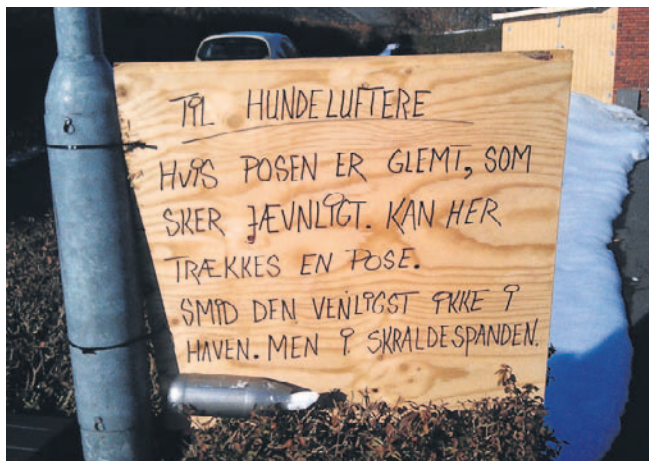
På Bjørnemøllevej ses denne opfordring!.

I Præstemosen har vi fået opsat et affaldsstativ ved Shelteren – husk nu posen og benyt affaldsstativet!