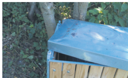
Ødelagt affaldsstativ.