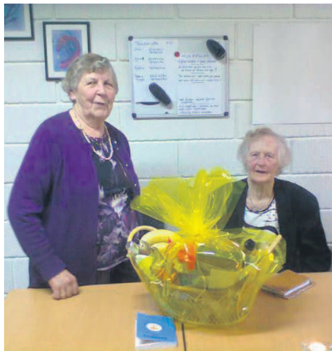
Afgående og ny formand.

Det har været en spændende og turbulent tid. Pensionistforeningen holdt i starten til i det gamle kommunekontor, hvor også aktivitetscenteret havde til huse. Hasle Kommune skulle imidlertid også spare og nedlagde aktivitetscenteret. Så gik pensionistforeningen ind og overtog ledelsen.