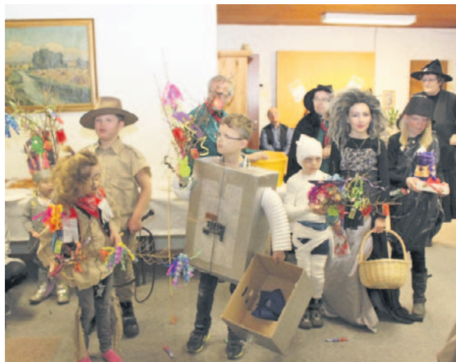
De bedst udklædte blev hædret med KFUM Spejdernes fastelavnssris.

Ca. 110 børn og voksne deltog i eftermiddagens arrangement, heraf ca. 40 til aftenspisning med millionbøf og kartoffelfmos.