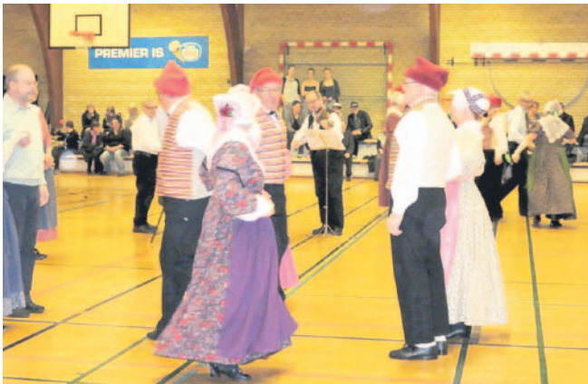
Folkedansernes opvisning.

Dejligt, at der fortsat er gang i gymnastikken selvom den har svære kår efter at skolen er lukket, men værdien af det arbejde instruktører og udvalg lægger for dagen kan ikke påskønnes nok, så derfor er opfordringen også til forældrene at give en hånd med, så gymnastikken fortsat kan lokalforankres i Klemensker. ID