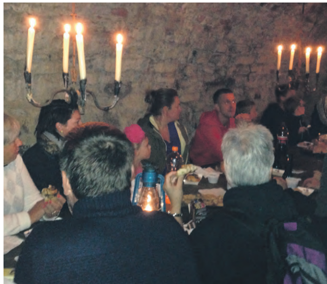
Turen til Hammershus, hvor kaffe/the og kage blev indtaget i smørkælder.

Det var sådan en flot aften med en yndig solnedgang, så vi startede med at indtage kaffe/the og kage i den varme og hyggeligt belyste smørkælder. Derefter gik vi tur rundt i ruinerne i flagermuslygternes