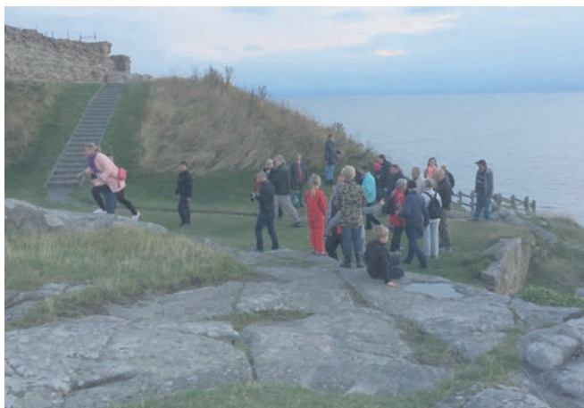
Aftenturen til Hammershus - udsigt over havet.