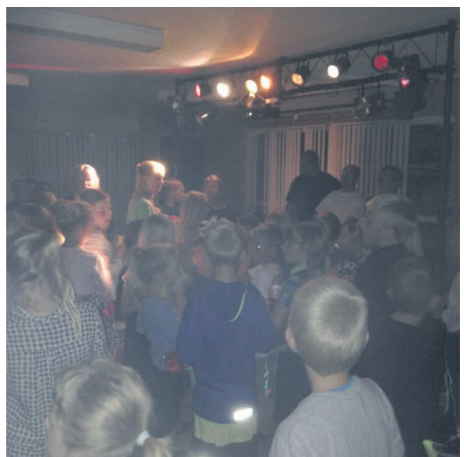
Et kig ind til dansegulvet og diskotek Freestyle.