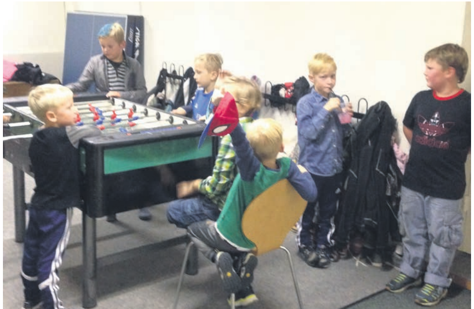
Drengene ved bordfodbold.