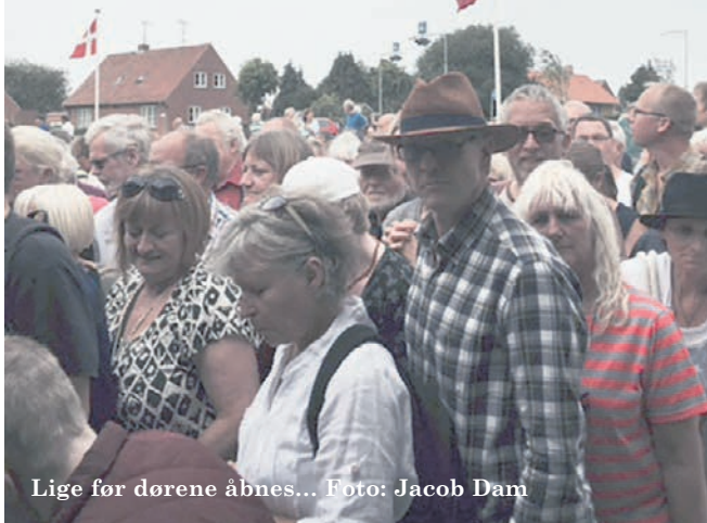
Lige før dørene åbnes...