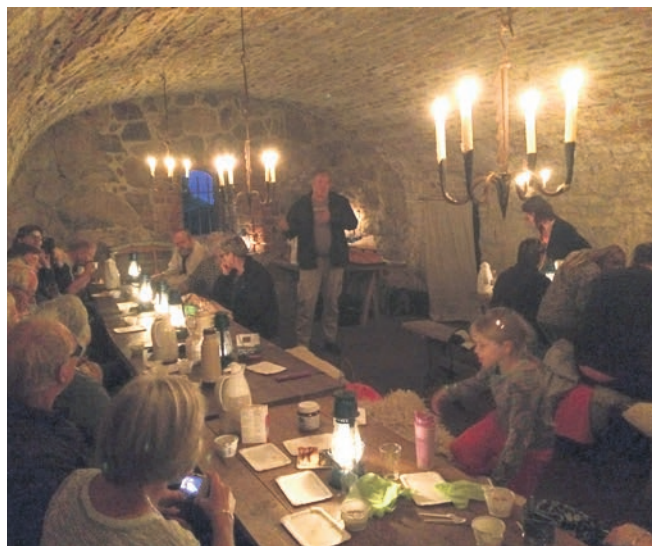
Kaffedrikning i Smørkælderen.