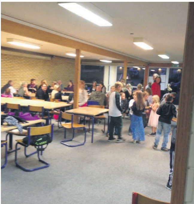
Lige før det går løs.