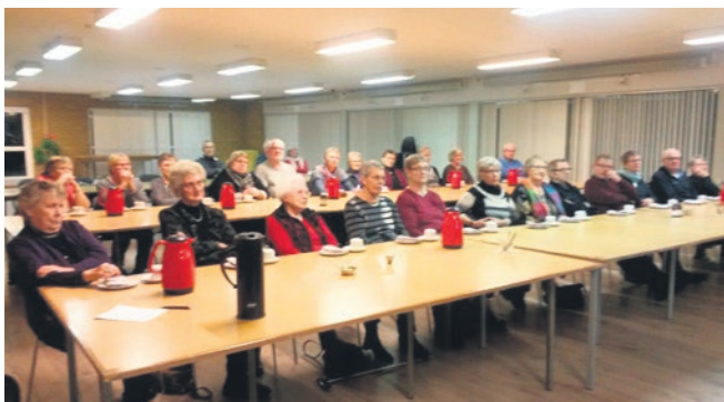
De deltagende klar til at høre nyt fra de to politikere.