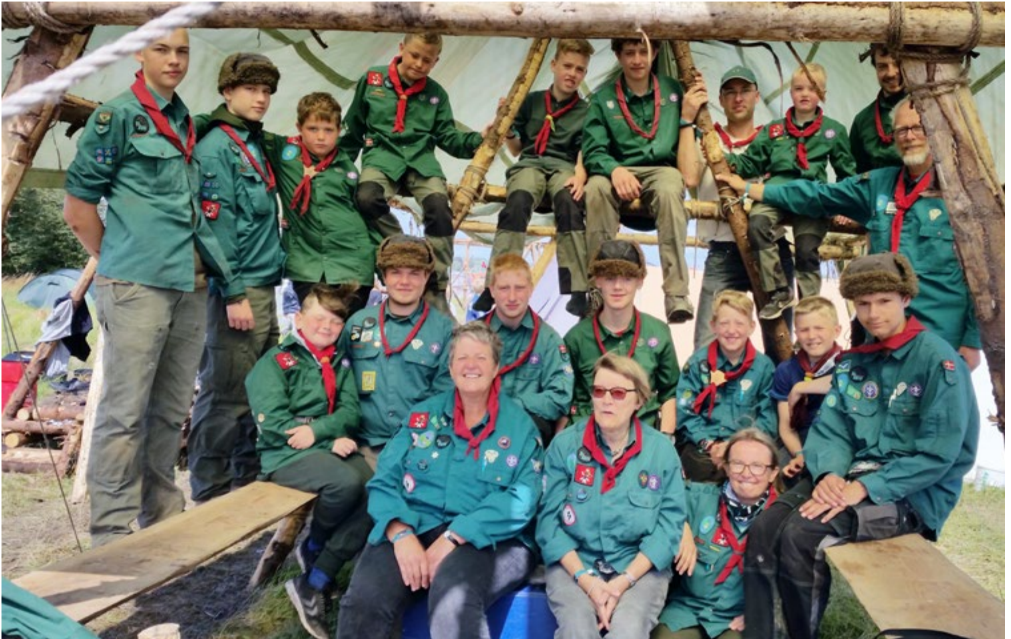
KFUM-Spejderne i Sønderborg.