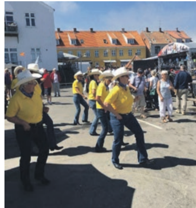
Sankt Hans Sandvig