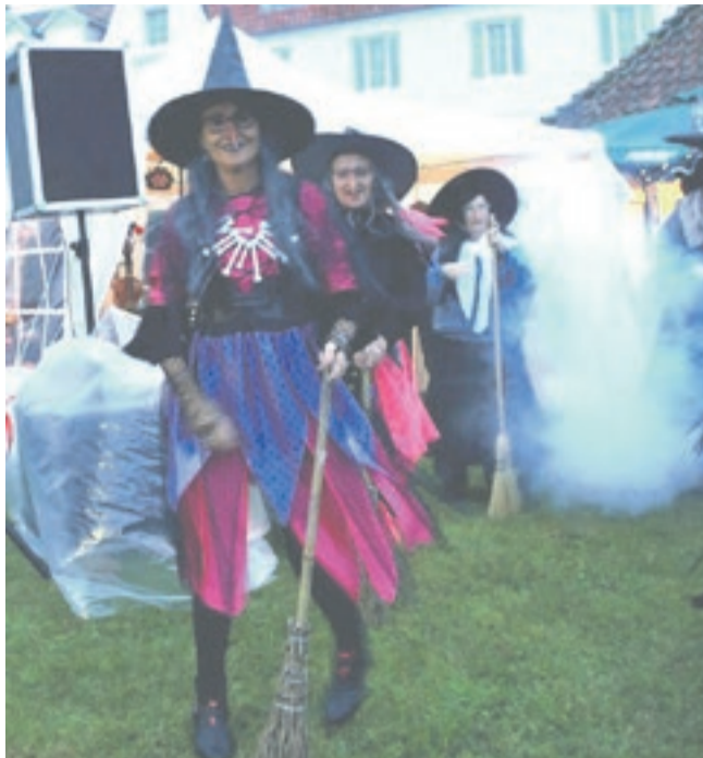
Folkemødet Catalan Style

Vi håber at se en masse nye ansigter i den kommende sæson, – både nogen der aldrig har prøvet at danse linedance før, men også linedancere som måske har holdt en pause fra linedance, og som gerne vil i gang igen. Her er plads til alle, både børn (fra 9 år) og voksne M/K, og alle er velkomne til at kigge forbi og få et par gratis prøvetimer, inden man melder sig ind.